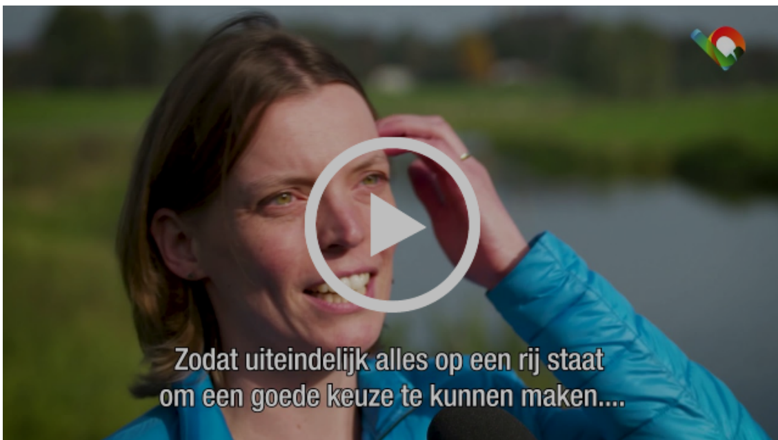
Lob Actueel aflevering 5

De vijf afleveringen zijn hier te bekijken.