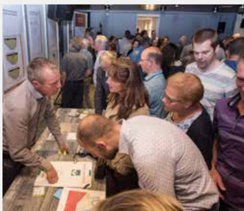
Milsbeek, 5 september 2019

Om de voortgang van het project 'Lob van Genneep' toe te lichten, organiseren we twee informatiemarkten die je doorlopend kunt bezoeken (bepaal dus zelf welk tijdstip je past):