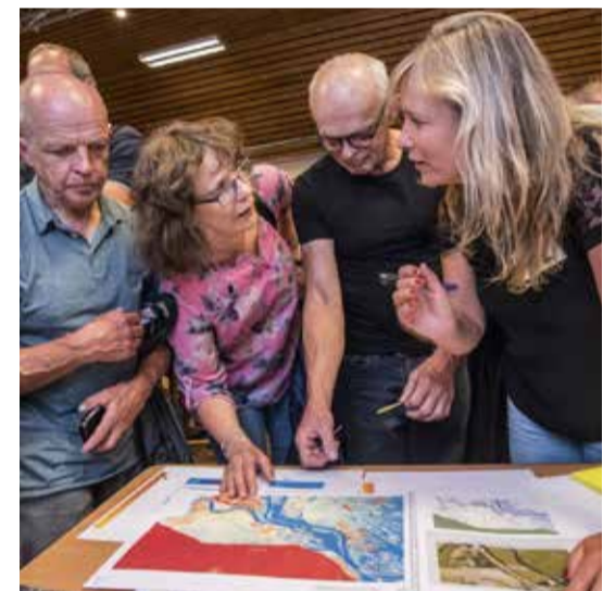
Ven-Zelderheide, 2 september 2019